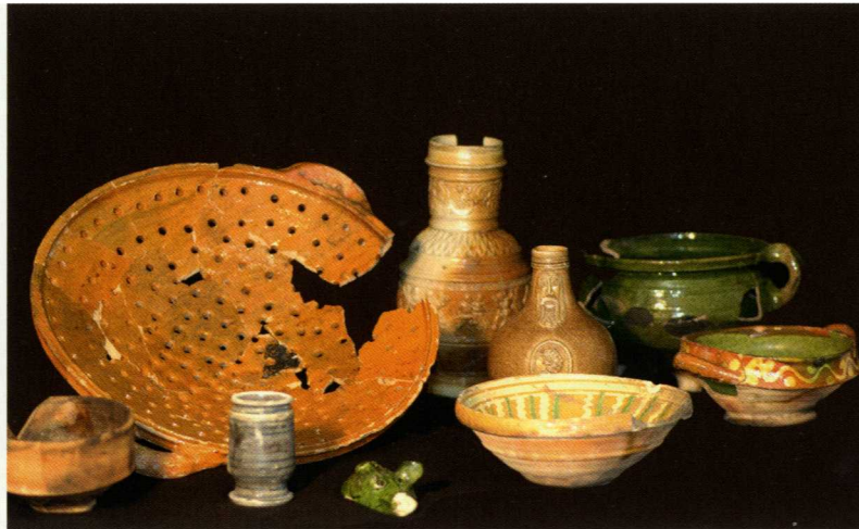
Vondsten uit één van de inpandige beerkeldertjes in Mijnsherenherberg (eind 16e -begin 17e eeuw).