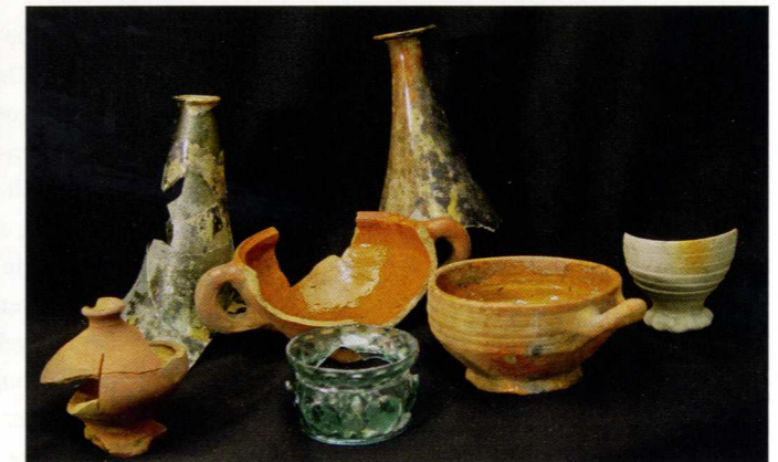
Vondsten uit de 15e-16e eeuwse beerkelder.

Maar een paardenkaak met glijsporen aan de onderkant, verraadt een tweede leven als 'priksleetje'. Kinderen konden hier in de winter mee sleeën op het ijs.