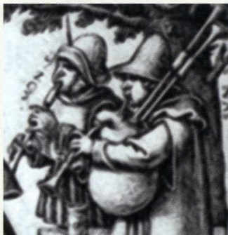
Ets van Hans Sebald Beham (Duitsland) met voorbeeld van een 16e-eeuwse schalmel (links) en doedelzak (rechts). De twee pijpen rechtsboven zijn de zogenoemde brompijpen.

met een vloer van rode en zwarte tegels in dambordpatroon en Delftsblauwe tegeltjes met een bloemenpatroon op de muren. Het huis wordt ook groter, want in het begin van de 17e eeuw wordt een deel van een naastgelegen woning aan het pand toegevoegd. In deze periode zijn er ook inpandige beerputten (toiletten) en een bakstenen riool aanwezig, hoewel buiten, op één van de achtererven, ook nog een (18e-eeuwse) beerkelder is gevonden.