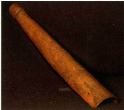
Een vermoedelijke houten brompijp van een doedelzak uit de 15e-16e eeuwse beerkelder op het achtererf van Mijnsherenherberg.