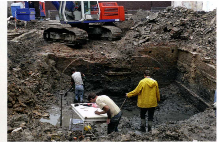
Het voorhuis van 'Mijnsherenherberg', gezien vanaf de Voorstraat. Te zien is de brede tussenmuur met de (later dichtgezette) ingang tussen het voorhuis en de kelder in het achterhuis.