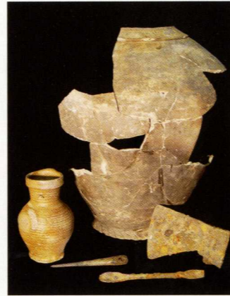
Vondsten van de 13e-eeuwse bewoningsfase.

Het viel wel op: ineens was daar een groot gapend gat ter hoogte van Voorstraat 244, waar voorheen Monti Meubel had gezeten. En als er op zo'n plek in de historische binnenstad nieuwbouw wordt neergezet, komt daar zeker archeologisch onderzoek bij kijken! Zodoende trokken de archeologen van Bureau Monumentenzorg en Archeologie in de zomermaanden van dit jaar het 'veld' in.