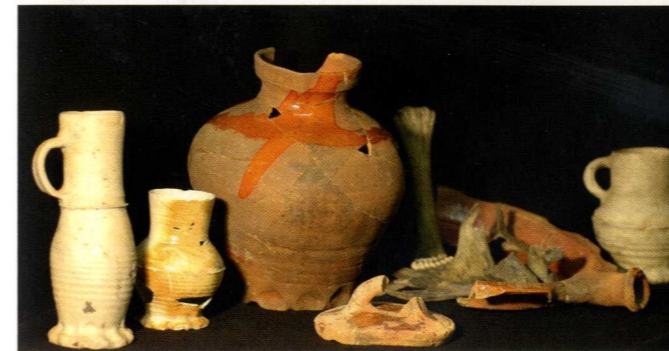
Vondsten uit het 14e eeuwse beerkeldertje.