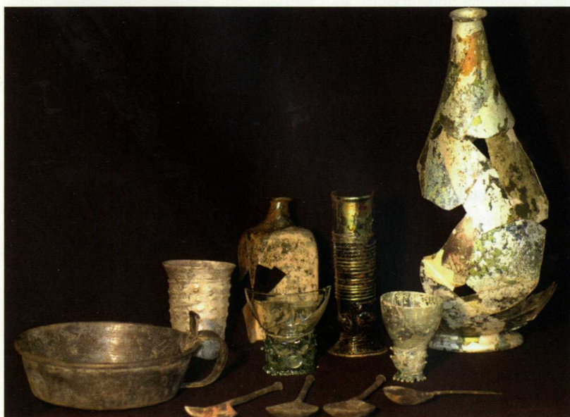
Vondsten uit één van de inpandige beerkeldertjes in Mijnsherenherberg (eind 16e -begin 17e eeuw).

Bureau Monumentenzorg en Archeologie van de gemeente Dordrecht publiceert de resultaten van de opgraving in een opgravingsrapport. Zodra dit gereed is (naar verwachting eerste helft 2009), is het te vinden op www.dordrecht.nl/archeologie