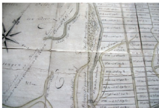
De Zanddijk in 1788