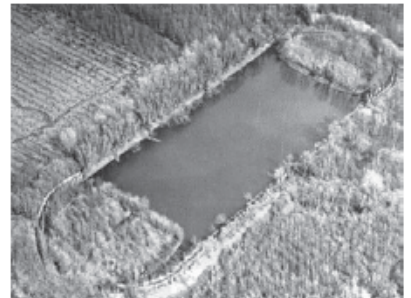
Eendekooi bij Bovense Beverluisplaat