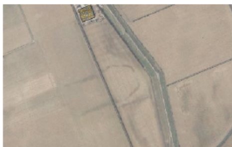
Een knik in de Zanddijk

Dwars door de Louisapolder en de Beerpolder in Dordrecht moet een nieuwe landbouwweg komen. Bij de bestudering van een luchtfoto van het gebied uit 2003, zijn echter opmerkelijke vormen of sporen direct ten westen en precies in de knik van de Zanddijk gezien. Het is onduidelijk om wat voor sporen het gaat. Zijn het resten van in 1421 verdrinken dorpen zoals Twintighoeven of Wieldrecht? Of zijn het misschien eendenkooien uit de tijd van de inpolderingen?