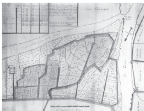
De Oude Beerpolder in 1727