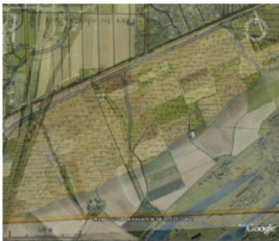
Historische kaart uit 1673 over het huidige landschap

Voorlopig blijft het dus onzeker: eendekooien aan de Zanddijk of niet? De andere mogelijkheid, dat op deze plaats een verdronken dorp zou hebben gelegen, kan wel worden uitgesloten. Bij onderzoeken zijn daarvoor geen aanwijzingen gevonden.