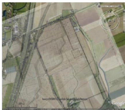
Google Earth foto met een projectie van de kaart van 1720

Op een kaart uit 1788 staat de Zanddijk met de opvallende knik wél aangegeven en wordt dan 'kade' genoemd. Ten westen van de Zandkade ligt een groot aantal putten waaruit aarde voor de aanleg van de kade is gehaald, een zogenoemde aardhaalstrook. Het water dat ten westen van en parallel aan de Zanddijk sroomt, wordt de Kooikille genoemd en er ligt een keet.