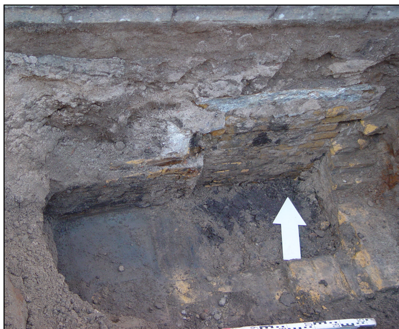
Afb. 2. Het gevonden 17 e - 18 e -eeuwse riool. Links is het, door een natuurstenen dekplaat afgedekte, riool te zien dat rechts uitkomt op een bezinkputje.